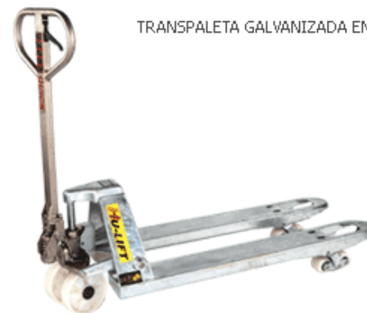
TRANSPALETA GALVANIZADA EN CALI